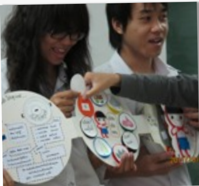
สื่อที่เอื้อต่อการพัฒนา AFFECTIVE DOMAIN

3. Cognitive Domain คือสื่อที่ส่งเสริม ความรู้ ความเข้าใจในกระบวนการ และวิธีการทำอาหาร