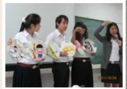
กิจกรรมสังเคราะห์การเรียนรู้จากการลงปฏิบัติผ่านการทำนิทานสำหรับเด็ก โดย นิสิตระดับ ปริญญาตรี ชั้นปีที่ 2 สาขา วิชาการศึกษปฐมวัย คณะครุศาสตร์