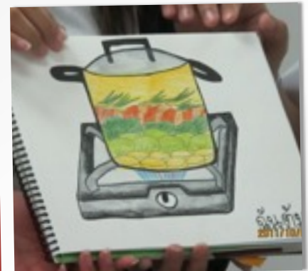
สื่อส่งเสริมการพัฒนา COGNITIVE DOMAIN