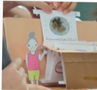
สื่อที่เอื้อต่อการพัฒนา SENSORY DOMAIN